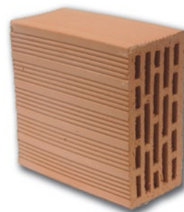
Forato 12x25x25 Pesante "Superpor®"

Peso: 6,60 Kg Pezzi m 2 : 16 Pezzi pacco: 128 Peso pacco: 845 Kg